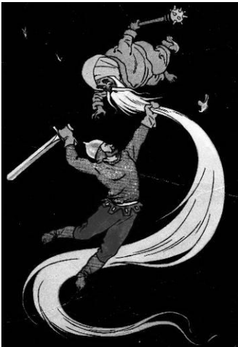
художник Г.О. Вальк