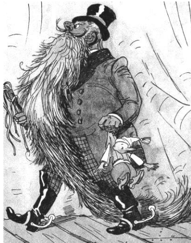
художник А.М. Каневский